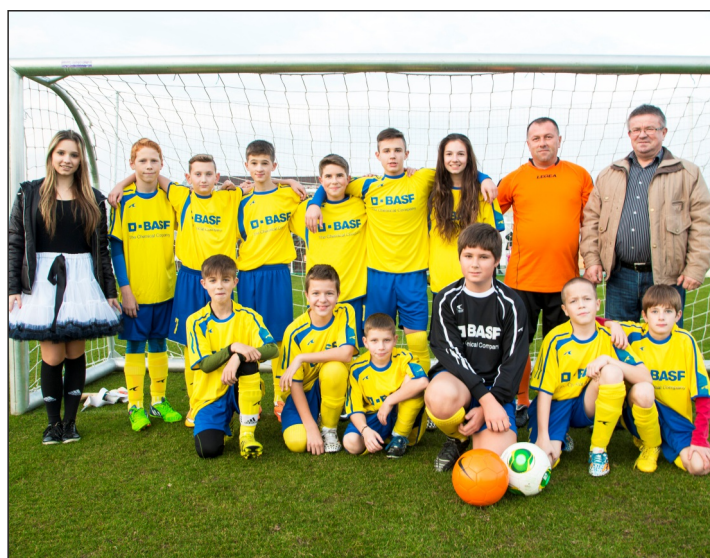
Mužstvo mladších žiakov