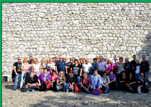
Členovia MO MS Slovenský Grob na zájazde v Osviečime.

Dňa 12.-13.09.2015 sa členovia Miestneho odboru Matice slovenskej Slovenský Grob zúčastnili poznávacieho zájazdu do Krakova a Osvienčimu. Po rýchlej ceste do Poľska sme si so sprievodcom prešli celé centrum Krakova. V nedeľu sme si prezreli múzeum koncentračného tábora v Osvienčime a Brezinke. Cestou späť sme sa zastavili na dobrý slovenský obed a potom už len rýchlo domov. Ďakujeme Obci Slovenský Grob za poskytnutie dotácie, ktorá nám pokryla aspoň časť nákladov na dopravu.