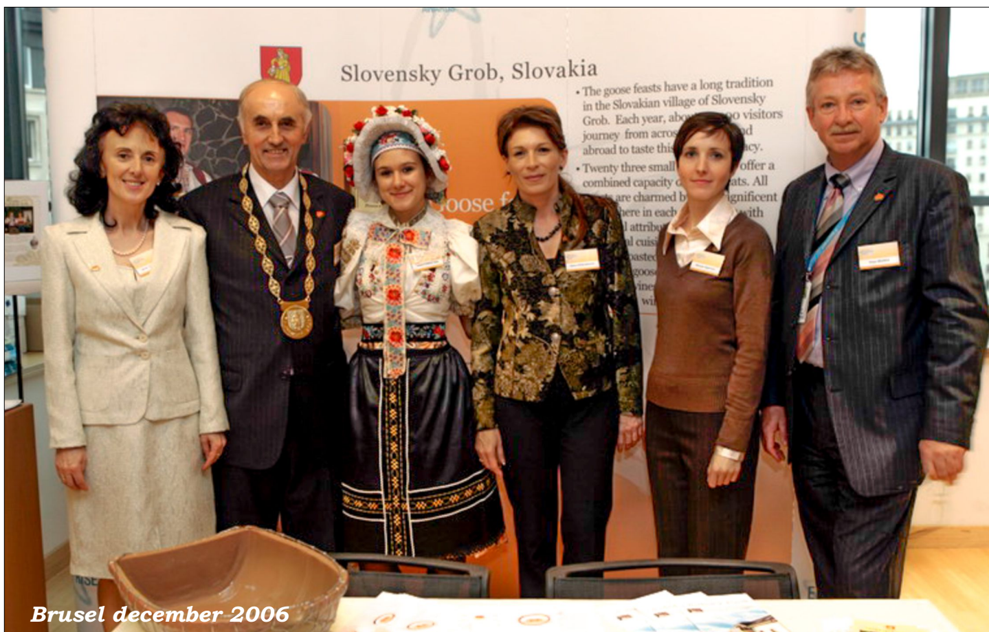
Brusel december 2006

Ďalšou krajinou, v ktorej slovenská diplomacia roky zohrávala významnú úlohu, a kde sa počas môjho pôsobenia naša krajina predstavila ako jedinečný, čestný sprostredkovateľ mierových rozhovorov, bol stredomorský ostrov Cyprus. Keď bola v Prezidentskom paláci menovaná skupina nových slovenských veľvyslancov, bola som určená, aby som sa na slávnosti preberania poverovacích listín prihovorila v mene všetkých kolegov. Vo svojom príhovore som vyzdvihla odhodlanie novo vymenovaných veľvyslancov šíriť dobré meno našej krajiny v štátoch nášho pôsobenia a rozvíjať dobré bilaterálne vzťahy. Ako slovenská