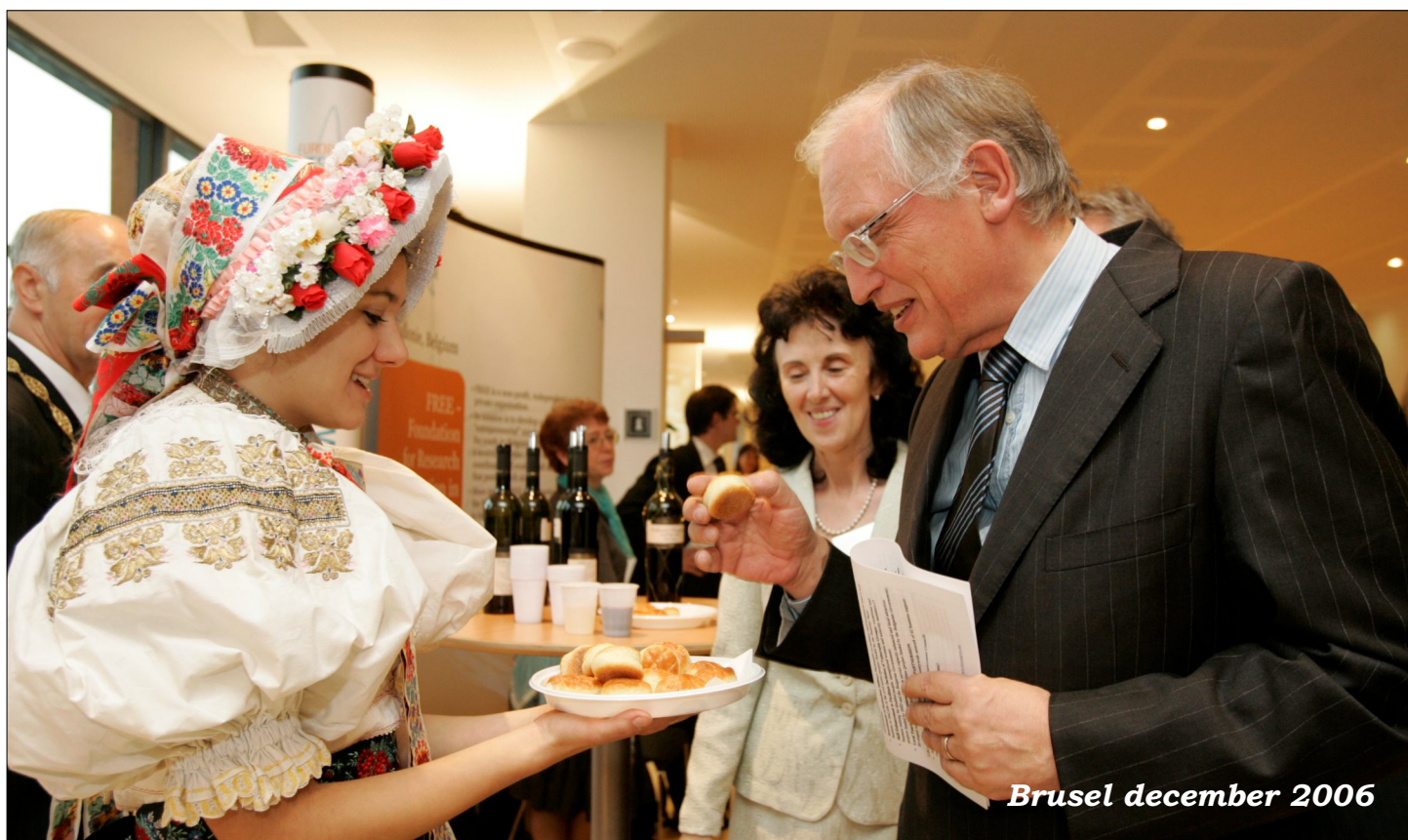
Brusel december 2006