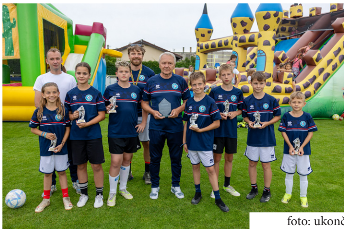
foto: ukončenie sezóny 2023-2024

Naša vďaka patrí aj hráčom z tímu „oldboys“, ktorí pravidelne a nezištne pomáhajú s chodom klubu a prispievajú k udržiavaniu tradície amatérskeho futbalu v obci. Vďaka všetkým týmto ľuďom môžeme pokračovať v budovaní silnej futbalovej základne a udržiavať náš klub aktívny a úspešný.